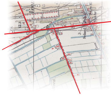
bouwfase 1 - 1935