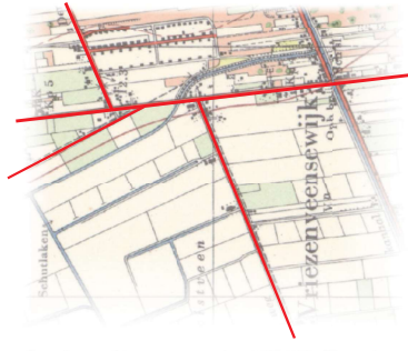
bouwfase 2 - 1960