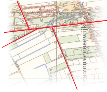
bouwfase 3 - 1965